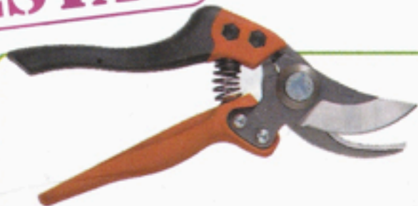
Bahco PX-M2, ca 400 kr, Bahco.

– en bra sekatör är guld värd i trädgården. Vi på redaktionen har testat 4 stycken.