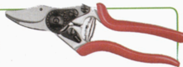
Felco 2, ca 400 kr, Felco.

Trevligt handtag med bra stuns. Bra balans. Otroligt svårt att lossa spärren med en hand men det blev lättare efter några försök. 18 mm står det som max diameter på kvistar, men då får man nog anlita Hulken för att orka knipsa av dem. Utbytbar blad och fjäder.