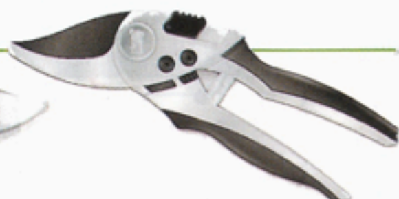
Karlstad expert, cirka 349 kr, Karlstad redskap.

En riktig rolls royce. Robust verktygsliknande utformning. Liten och välbalanserad, ligger bra i handen. Mycket lätt att låsa upp med en hand då man bara pressar ihop skänklarna. Passar perfekt för rensning i perennrabatten. Alla delar går att byta ut.